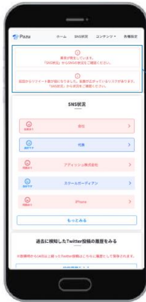
炎上モニタリングSaaS「Pazu」アラート画面イメージ

事前に登録したキーワードをもとに、X上の投稿を24時間365日検索、設定したリポスト数を超えた投稿を指定先にアラートして、迅速な対応が可能な「炎上対策」機能、炎上メカニズムやSNSリテラシーを学ぶことができるeラーニングコンテンツ、危機管理の専門コンサルタントに相談できる「リスク対策サポート」 (※3) を提供します。 https://pazu.io/